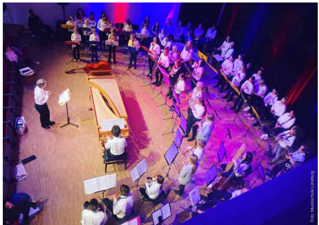
Im Saal der Musikschule der Hansestadt Lüneburg finden regelmäßig Konzerte statt.