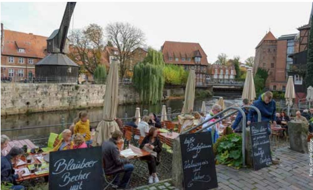
Historischer Stintmarkt im Wasserviertel Lüneburgs.

Elbe-Seitenkanal mit An- bindung ans europäische Binnenwasserstraßennetz und Direktverkehr zu Nord- und Ostseehäfen, Ilmenau