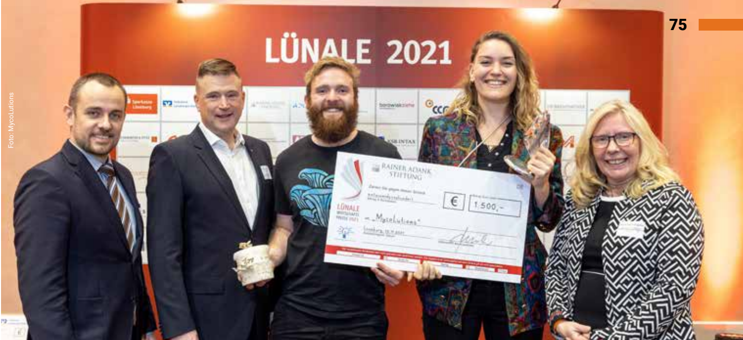
MycoLutions, Preisträger 2021 – Leuphana Gründungsidee des Jahres