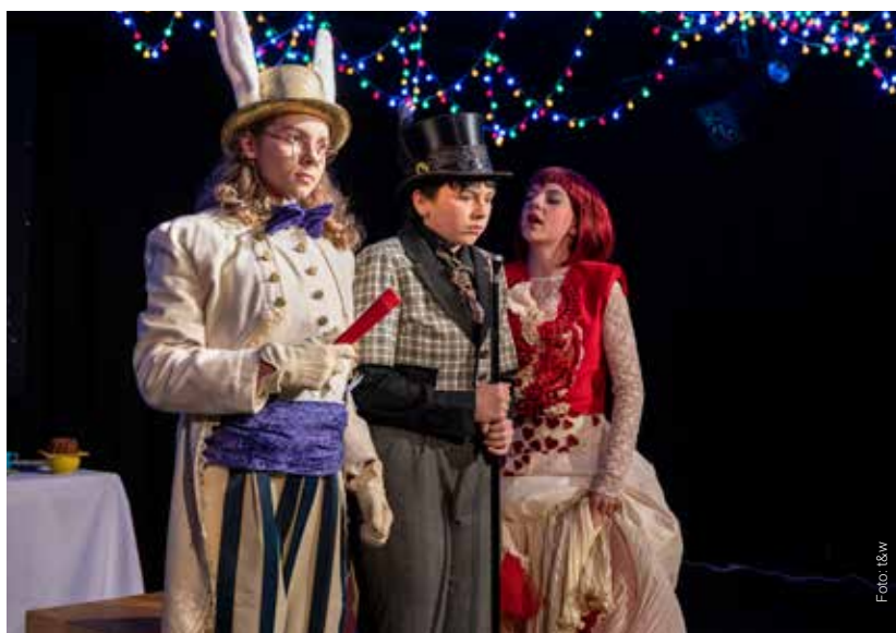
Das Theater im e.novum ist Theater und Schauspielschule zugleich.

Und wer die Theaterwelt einmal aus einer neuen Perspektive kennen lernen möchte, kann sich gern einer Führung hinter die Kulissen anschließen.