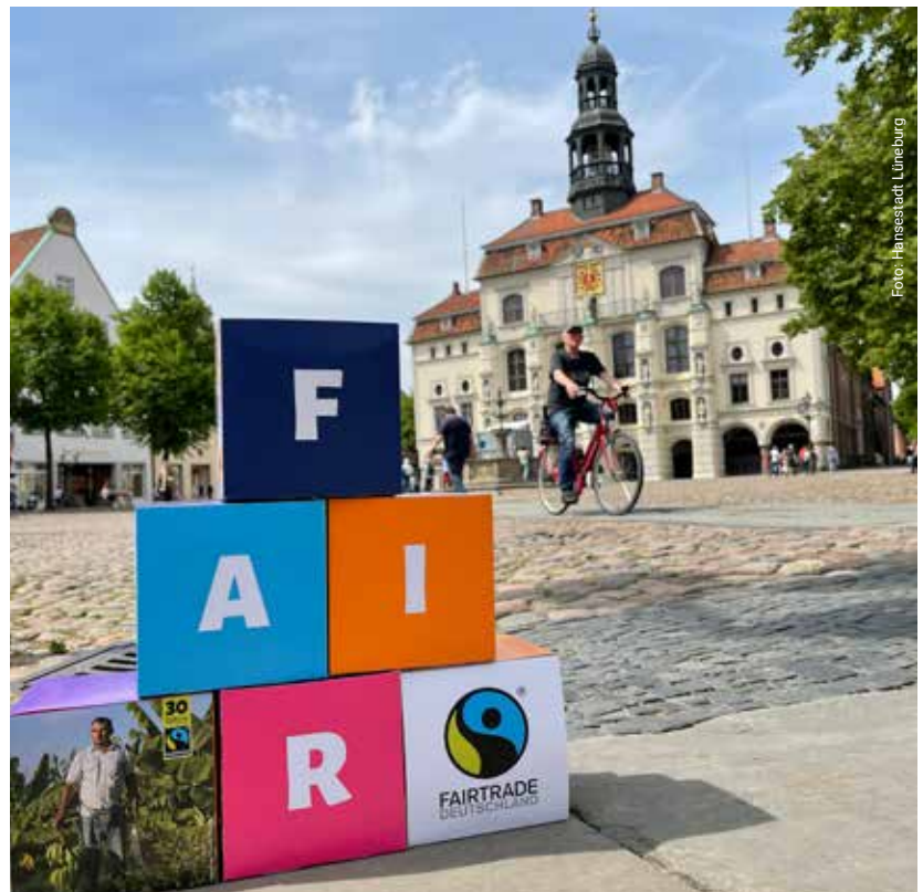
Lüneburg ist eine von weltweit mehr als 2000 Städten mit dem Titel Fairtrade-Stadt.

Zur Nachhaltigkeit gehört auch fairer Handel – Lüneburg ist daher stolz, als eine von weltweit mehr als 2000 Städten den Titel „Fairtrade-Stadt“ der Fairtrade-Towns-Kampagne zu tragen. Die Steuerungsgruppe aus Verwaltung, Gastronomie und Einzelhandel sowie Vereinen und Schulen heißt neue Mitglieder herzlich willkommen.