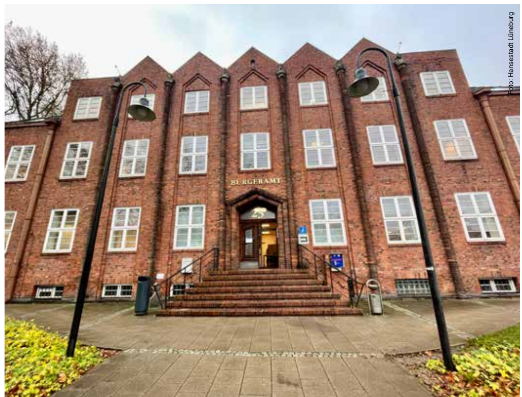
Möglichst viele Leistungen aus einer Hand anzubieten, ist Ziel des Bürgeramts.