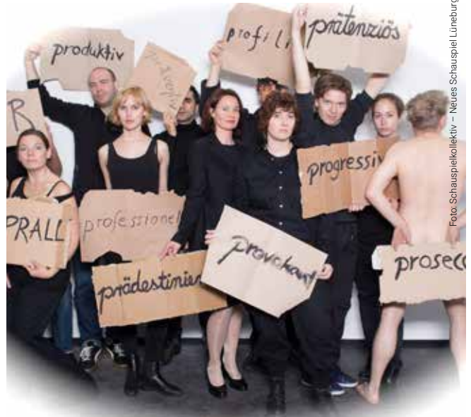
Das Schauspielkollektiv legt seinen Schwerpunkt auf Präventionstheater.