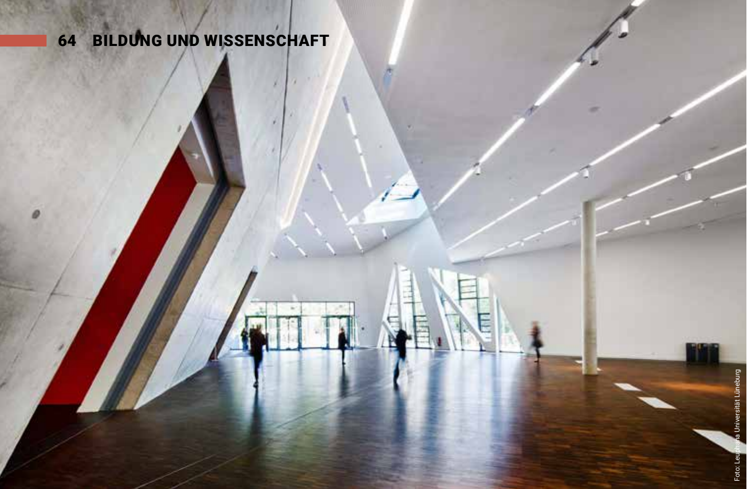
Foyer des Zentralgebäudes