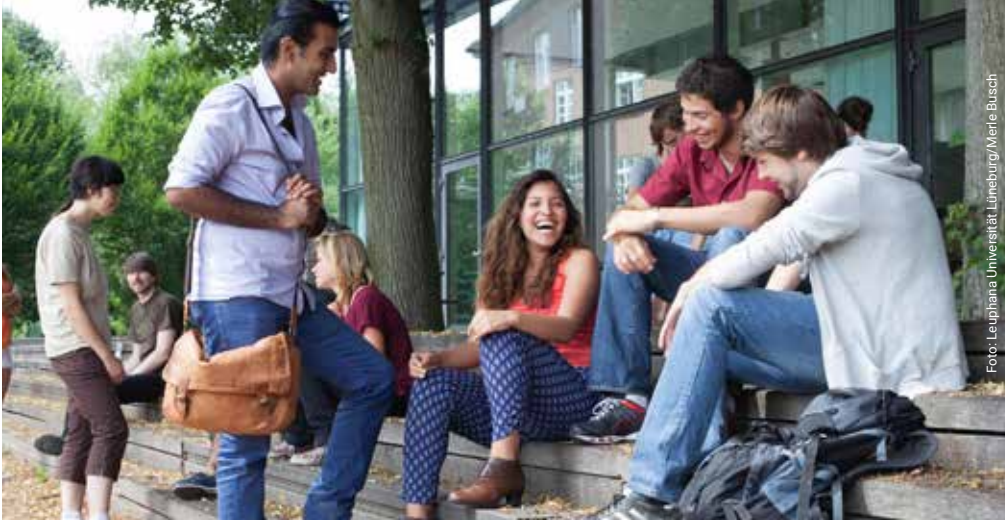
Studierende vor der Mensa