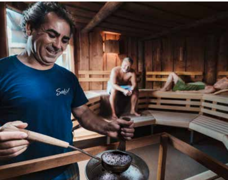
In der Sauna des SaLü