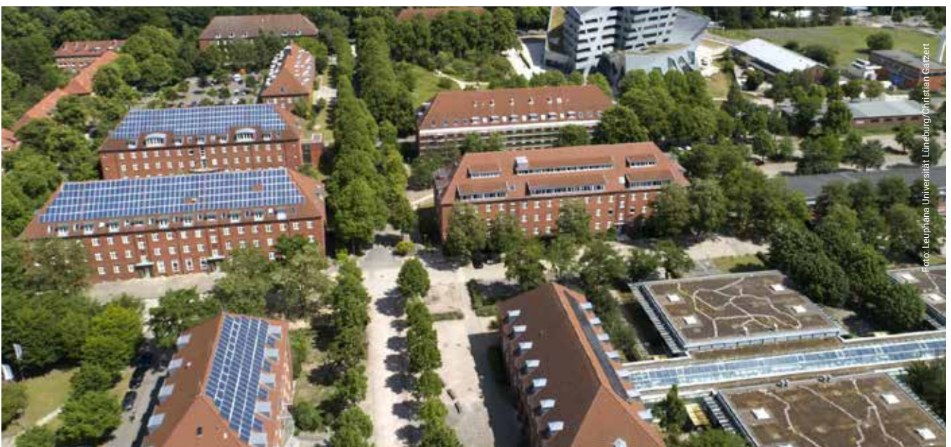
Luftaufnahme Leuphana Universität Lüneburg I

Universitäts- gesellschaft: https://ug-ig.de