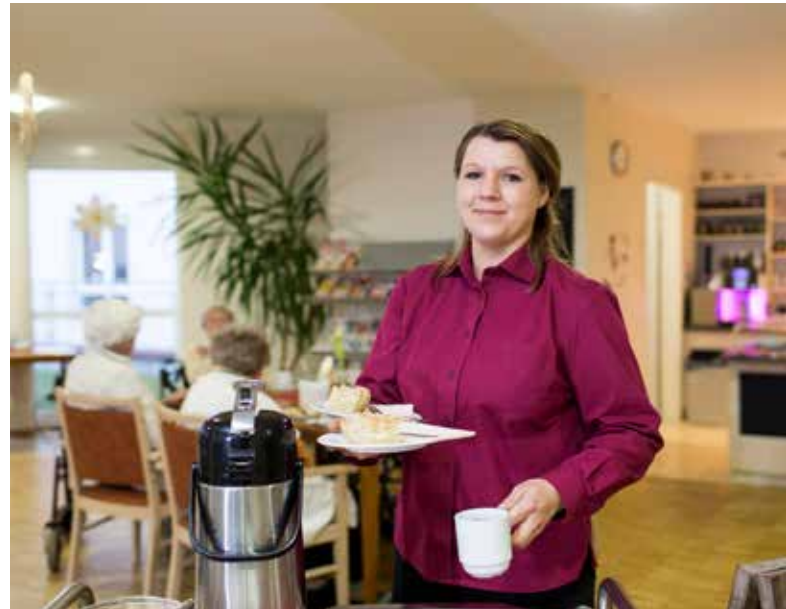
Mitarbeiterin von Service Plus Lüneburg im Seniorenzentrum Alte Stadtgärtnerei

und enge Kooperationen mit externen Partnern vervollständigen das umfassende Angebot. Das Klinikum ist Akademisches Lehrkrankenhaus des Universitätsklinikums Hamburg-Eppendorf (UKE).