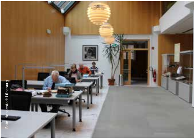
Das Archiv der Hansestadt mit seinem geräumigen, hellen Lesesaal steht grundsätzlich allen Interessierten offen.