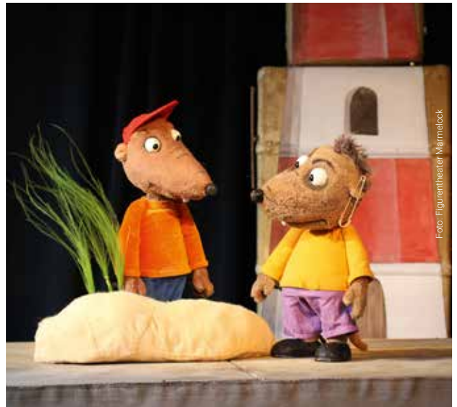
Das Figurentheater Marmelock spielt Stücke sowohl für Kinder als auch für Erwachsene.