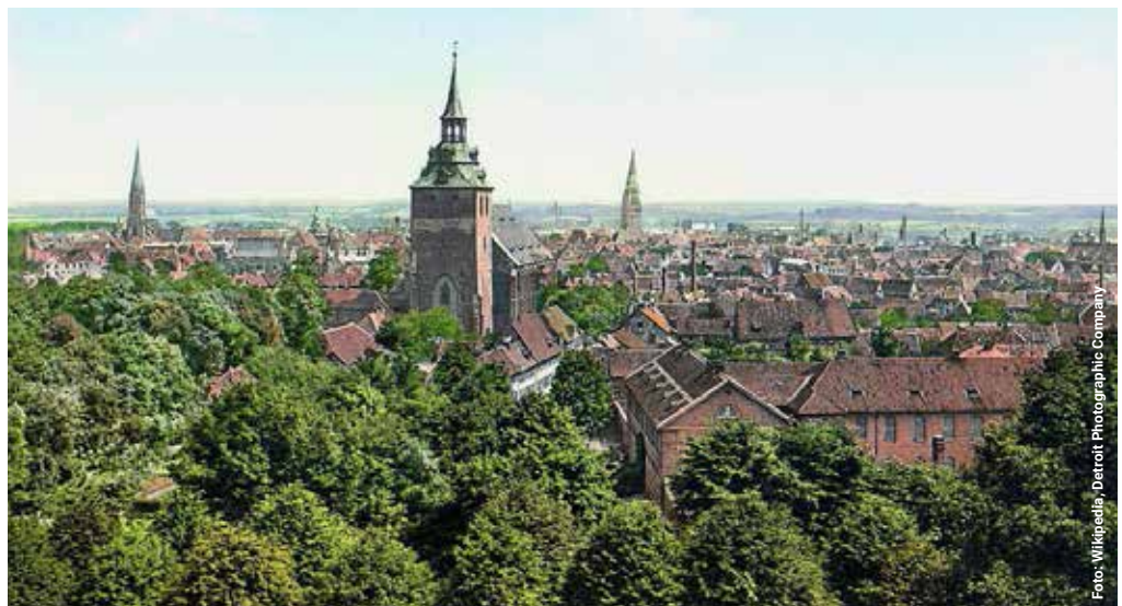
Blick vom Kalkberg auf die Nicolaikirche, St. Michaelis und St. Johannis.

Diese Idee verfolgt die Verwaltung der Hansestadt Lüneburg zusammen mit verschiedenen Partnern gerade auch, wenn es um Hilfen und Beratung angesichts von Inflation sowie Einsparmöglichkeiten von Gas und Strom geht. Die Kirchengemeinden und ihre Angebote spielen dabei eine wichtige Rolle. Die Idee zu dem Motto / Hashtag wurde auf der Lüneburger Stadtkonferenz im Sommer 2022 geboren. www.lueneburg-steht-zusammen.de