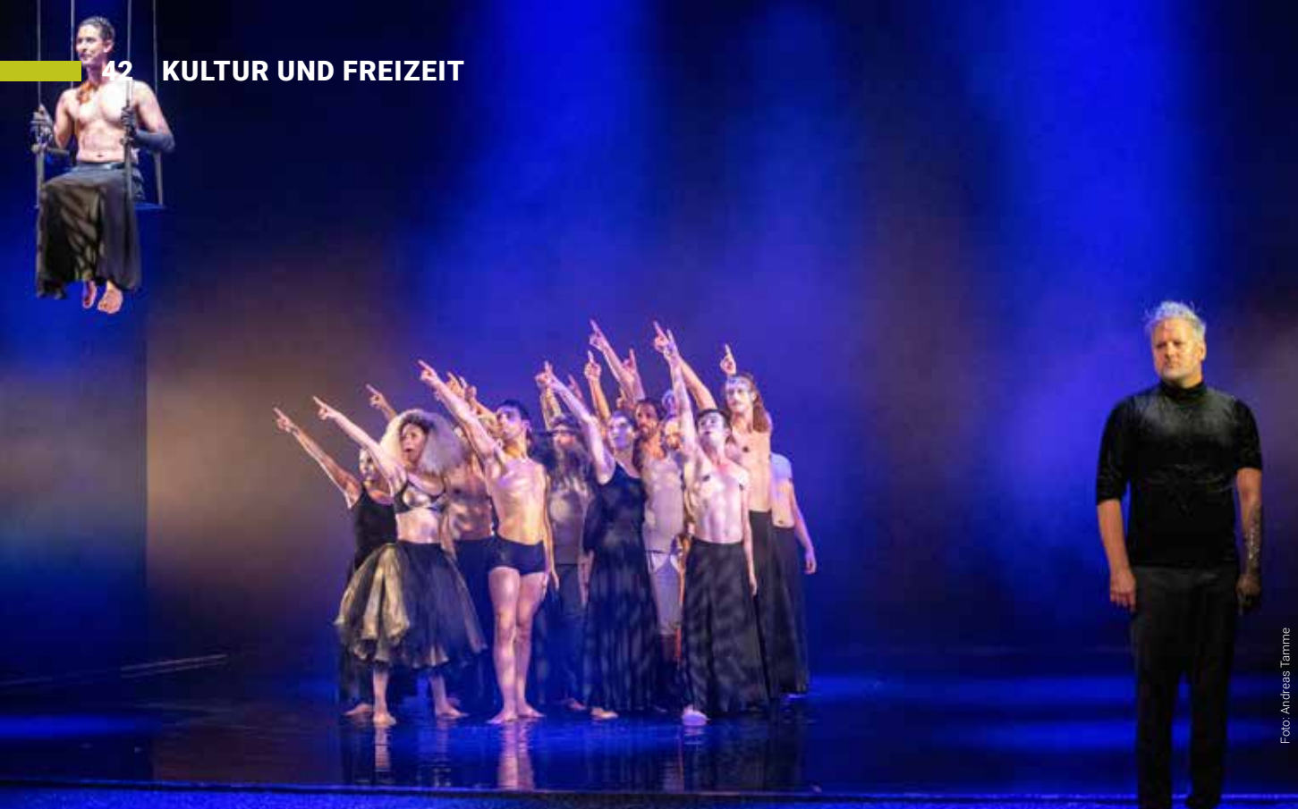
„Der Sturm“: Musiktheater nach William Shakespeare in einer Fassung des Theater Lüneburg.