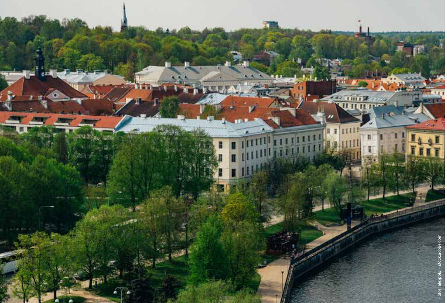
Bald Kulturhauptstadt ist Tartu, Lüneburgs Partnerstadt in Estland.