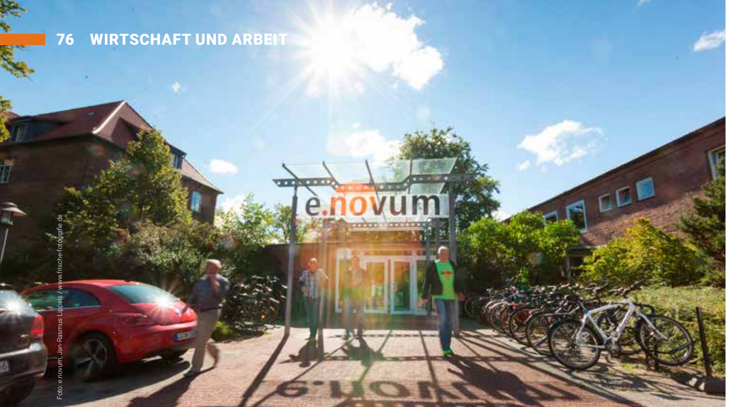
Innovations- und Gründerzentrum e.novum am Campus der Leuphana Universität.