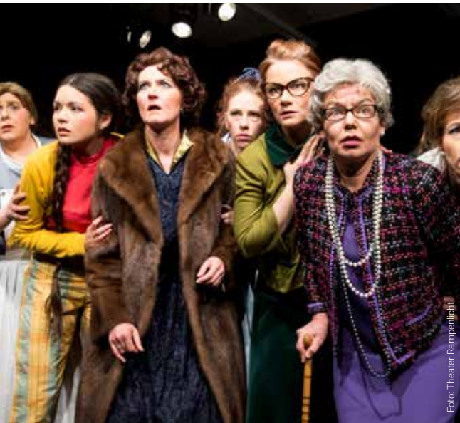
Das Rampenlicht-Amateurtheater ist regelmäßig in der KulturBäckerei zu erleben.