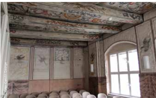
Im Heinrich-Haus mit seinen historischen Deckenmalereien finden Lesungen ein ganz besonderes Ambiente.

www.literaturbuero-lueneburg.de/junges-literaturbuero/