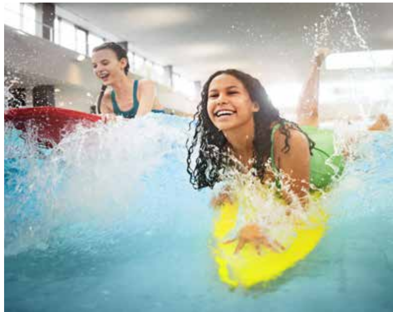
Im Wasserviertel des SaLü