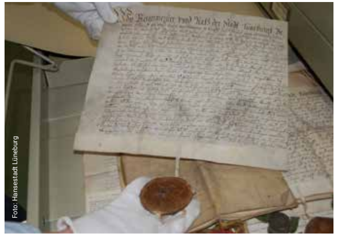
Urkunden, Fotos, Nachlässe und viele Schätze mehr aus mehreren Jahrhunderten sind im Stadtarchiv gut aufgehoben.