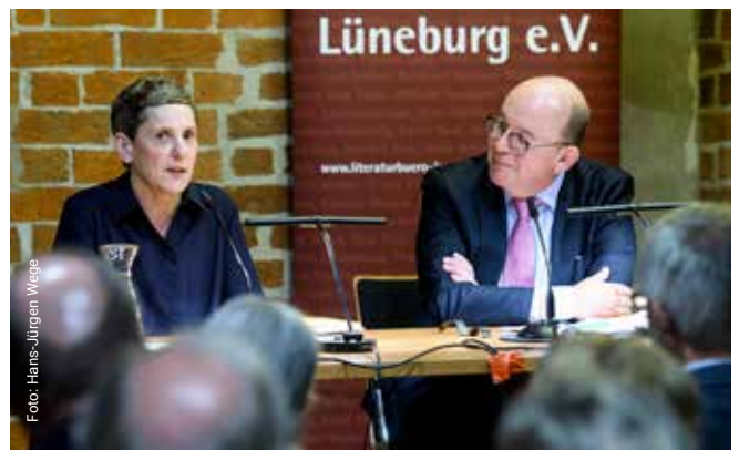
Das Literaturbüro holt hochrangige Gäste zu Lesungen in die Stadt, hier: Buchner-Preisträgerin Felicitas Hoppe (mit ARD-Literaturkritiker Denis Scheck).