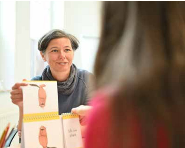
Psychiatrische Klinik Lüneburg