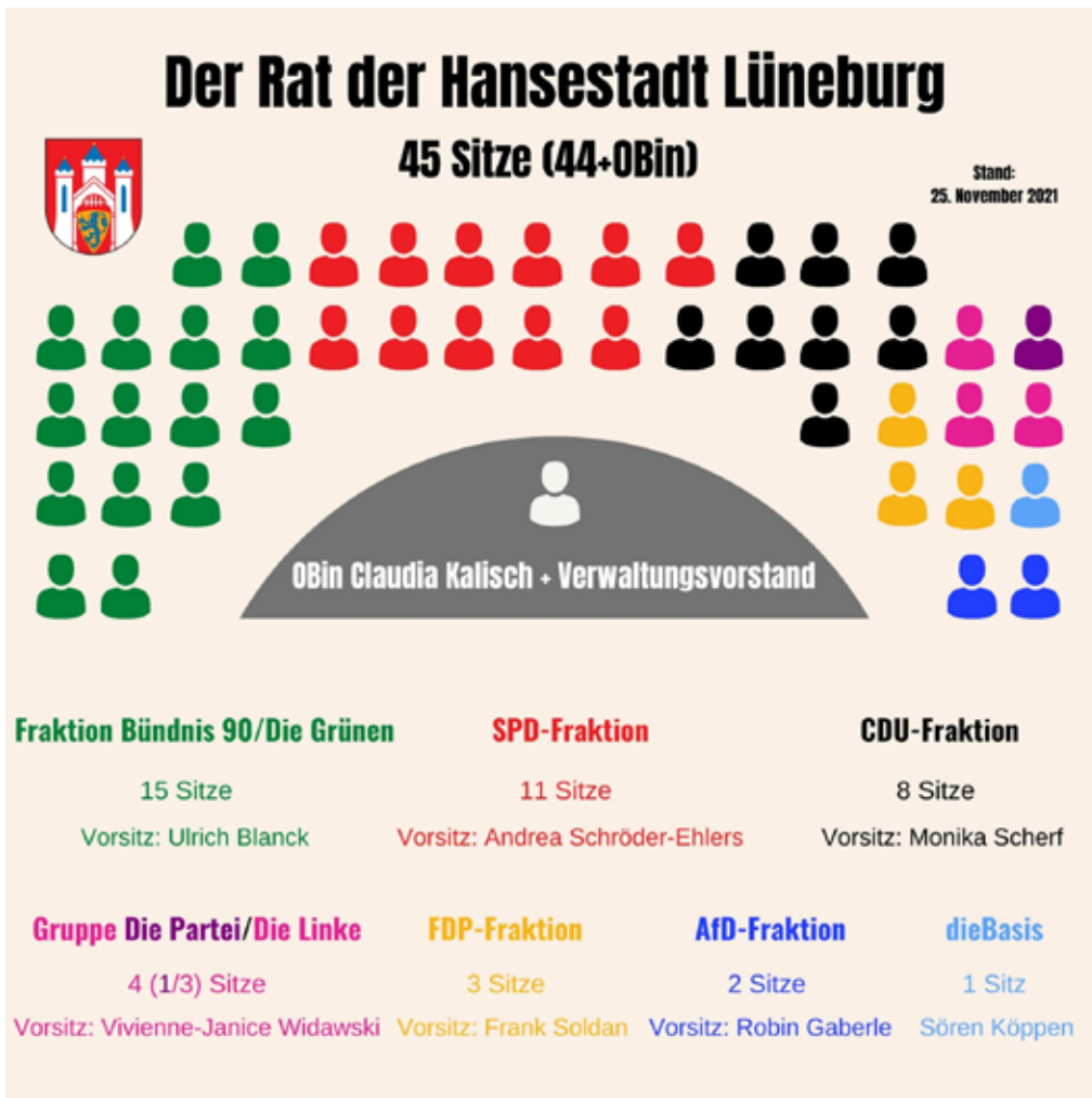
Grafik: Hansestadt Lüneburg